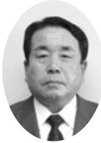
第49代 副議長 いけおまさひこ 池尾 正彦 64歳 無所属 3期目